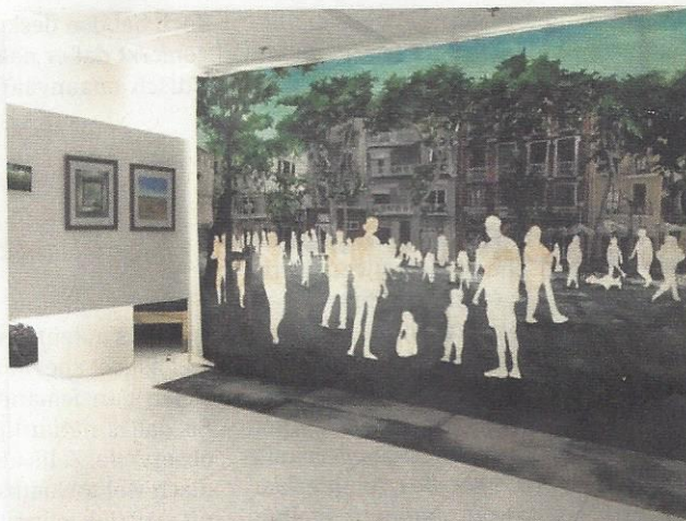
'PLAÇA DE LA VIRREINA', AKHA HULZEBOS, 2016, ACRYL OP DOEK. AUGMENTED REALITY, TE ZIEN MET APP AURASMA

"Digitale kunst speelt zich vooral af binnen bepaalde circuits. Wij zijn heel erg geïnspireerd door Kees de Groot van