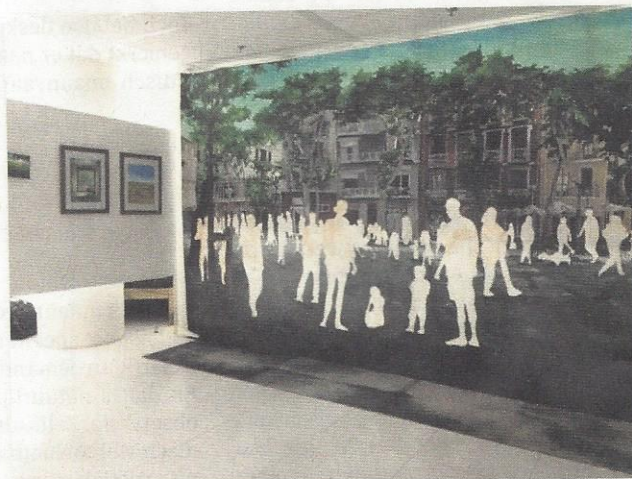
'PLAÇA DE LA VIRREINA', AKHA HULZEBOS, 2016, ACRYL OP DOEK. AUGMENTED REALITY, TE ZIEN MET APP ÀURASMA

"Digitale kunst speelt zich vooral af binnen bepaalde circuits. Wij zijn heel erg geïnspireerd door Kees de Groot van