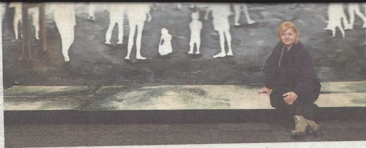
Christine van Stralen bij het schilderij van Akha Hulzebo dat tot leven komt met augmented reality.

Van Stralen, die in de jaren tachtig is afgestudeerd op kunst in kraakpanden waar toen al met de computerkunst werd geëxperimenteerd, vindt dat Almere dringend een museum nodig heeft. „Ik vind het echt niet kunnen voor een stad van 203.000 in-